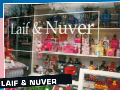
LAIF & NUVER

De term vlees-noch-visrestaurant was zelden zo juist en tegelijk zo onjuist. Blabla in de Nieuwe Boteringstraat (nr.9) is meer dan een welkome vluchthaven voor vegetariërs en veganisten. Blabla biedt lonkend perspectief voor iedereen die best eens een dagje zonder wil.