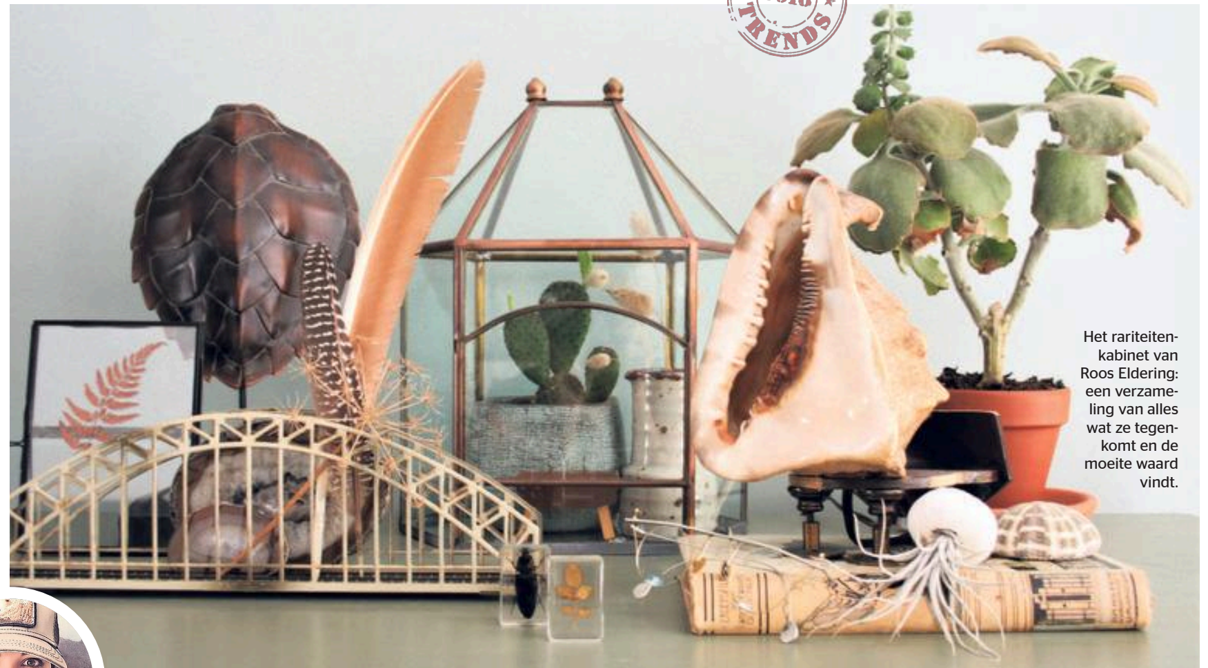
Het rareitenkabinet van Roos Eldering: een verzameling van alles wat ze tegenkomt en de moeite waard vindt.

Een (vintage) terrarium is perfect om je prullaria uit te stallen.