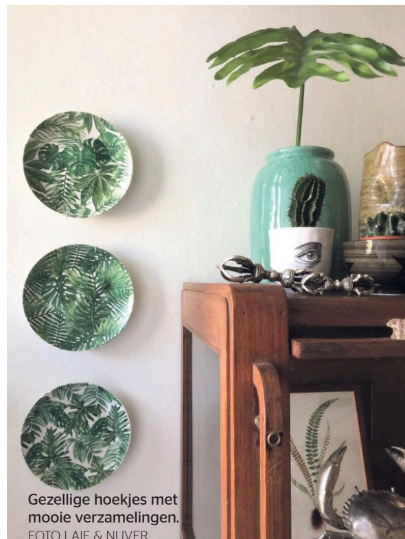
Gezellige hoekjes met mooie verzamelingen.

Wootrends volgen elkaar niet zo snel op als in de mode, maar desondanks valt elk er ook op interieurgebied elk jaar weer veel nieuws te ontdekken. Drie stylisten over hun favoriete wootrend voor 2018.